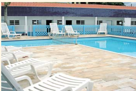
Colônia de Férias em Caraguatatuba

São José dos Campos - Se o trabalhador não quiser sair da região, pode optar pelo Centro de Lazer, à rua Dois, 1.133, Santa Cecília, São José dos Campos. Possui duas piscinas (adulto e infantil), quiosques, quadras e campo de futebol iluminado. As reservas de quiosques são feitas na sede do Sindicato. Apresente a Carteira de sócio e lista com o nome completo e RG dos convidados (limite de 25 pessoas). Ligue 3921.2455.