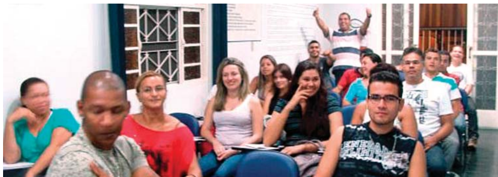
A turma da Administração amplia os conhecimentos e técnicas para atuar no setor

Mais de 120 alunos fazem parte da turma do curso de capacitação profissional de 2012 do Sindicato.