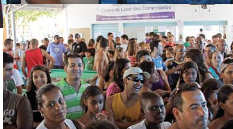
Prêmios e atividades esportivas agitam a tradicional festa de 1º de Maio em 2011. A família comerciária compareceu em peso