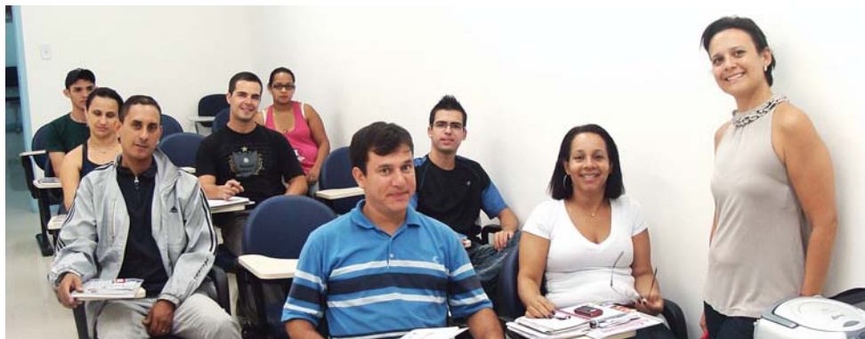
Com duração de quatro meses, a turma do curso de Inglês está empenhada