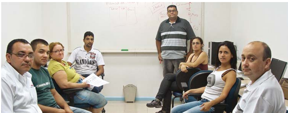
Na turma da Informática cada aluno tem o seu micro para acompanhar as aulas