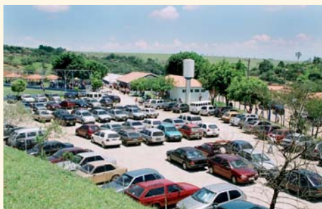
Centro de Lazer em São José dos Campos