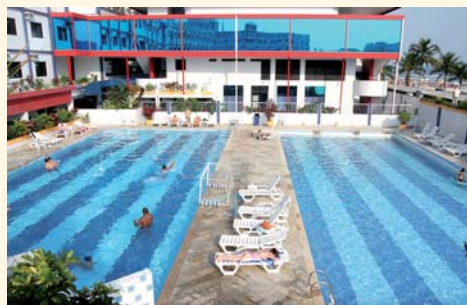
Centro de Lazer em Praia Grande